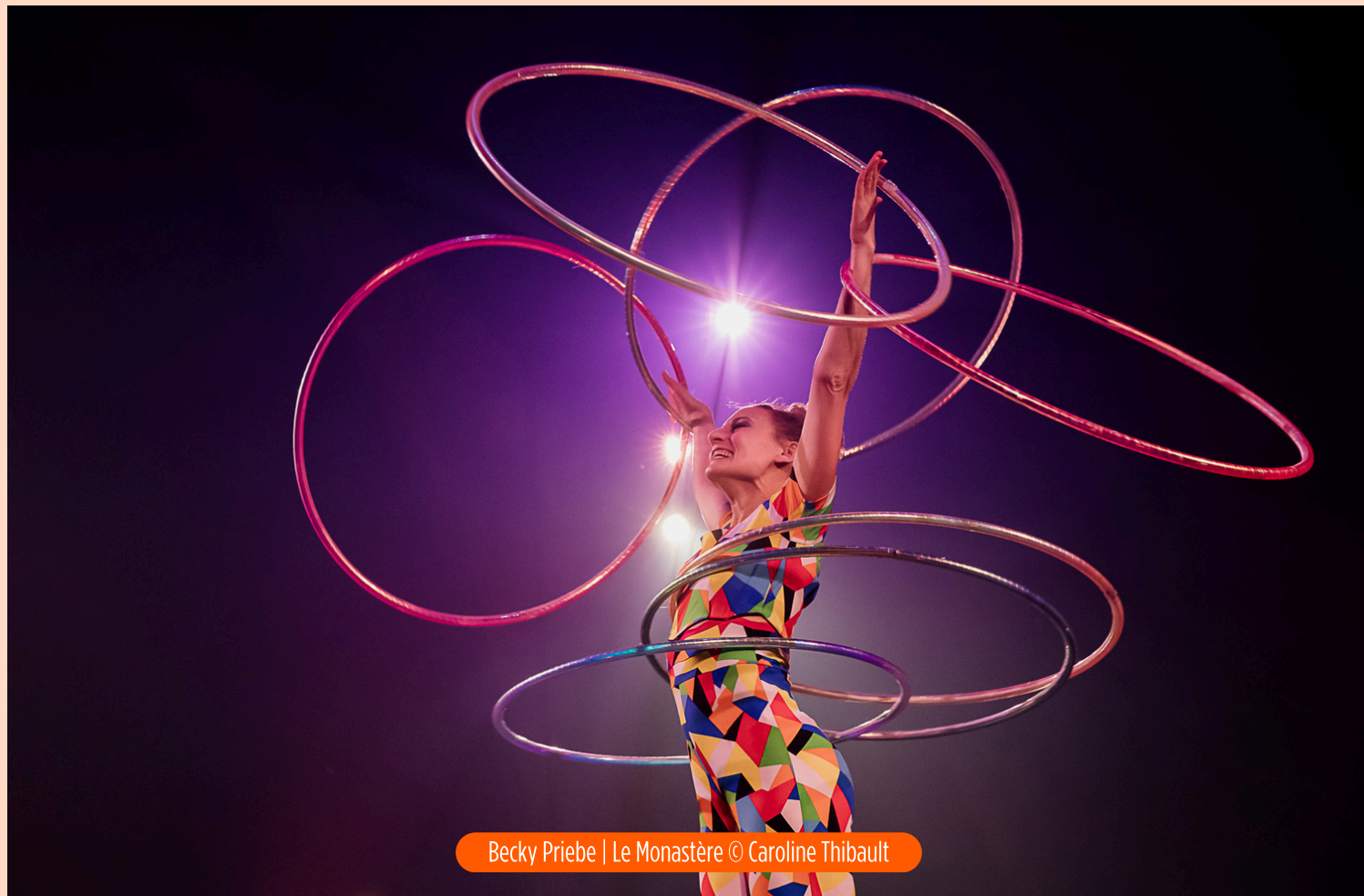
Becky Priebe | Le Monastère