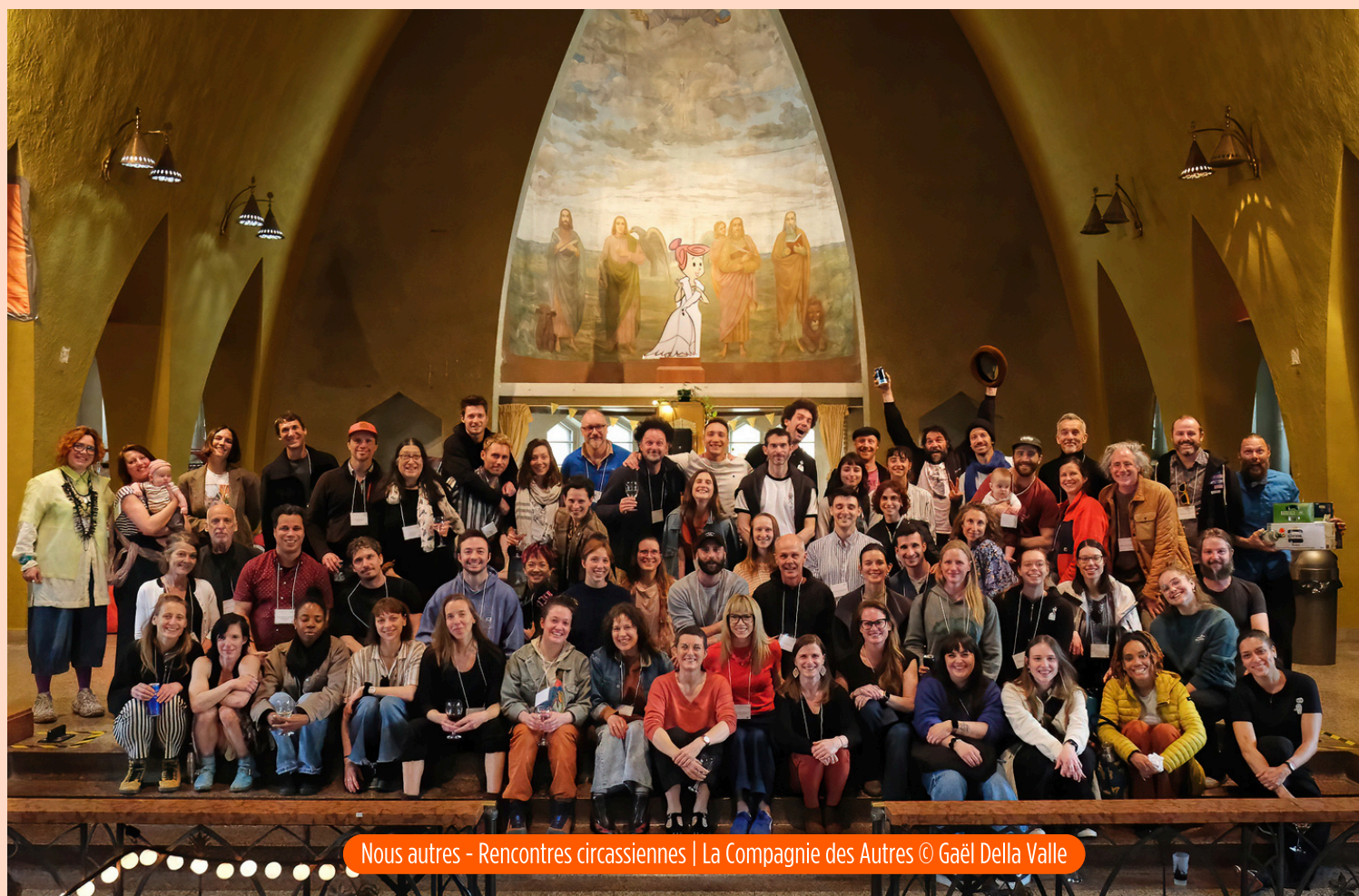
Nous autres - Rencontres circassiennes | La Compagnie des Autres © Gaël Della Valle